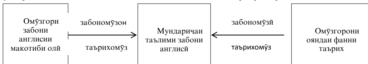
Расми № 1. Амсилаи омодагии забони омӯзгорони ояндаи фанни таърих дар раванди таълими забони англисӣ.

Диалектикаи ягонагии забонӣ ва таҳассусии омӯзгорони ояндаи фанни таърих дар заминаи мундариҷаи таълими забони англисӣ амсилаи дидактикии зеринро доро мебошад.