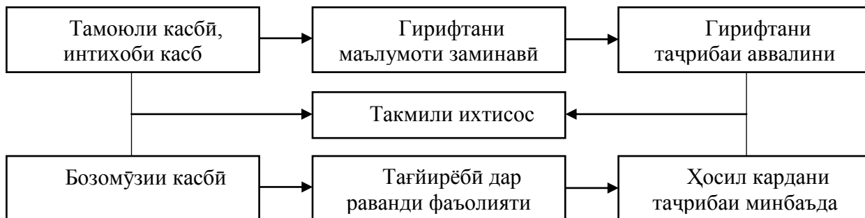
Расми 3. – Амсилаи раванди рушди касбии хизматчиёни давлатӣ

Мунтазам вусъат додани дараҷаи такмили маҳорати хизматчиёни давлатӣ дар давоми фаъолияти корӣ мақсаднок хоҳад буд.