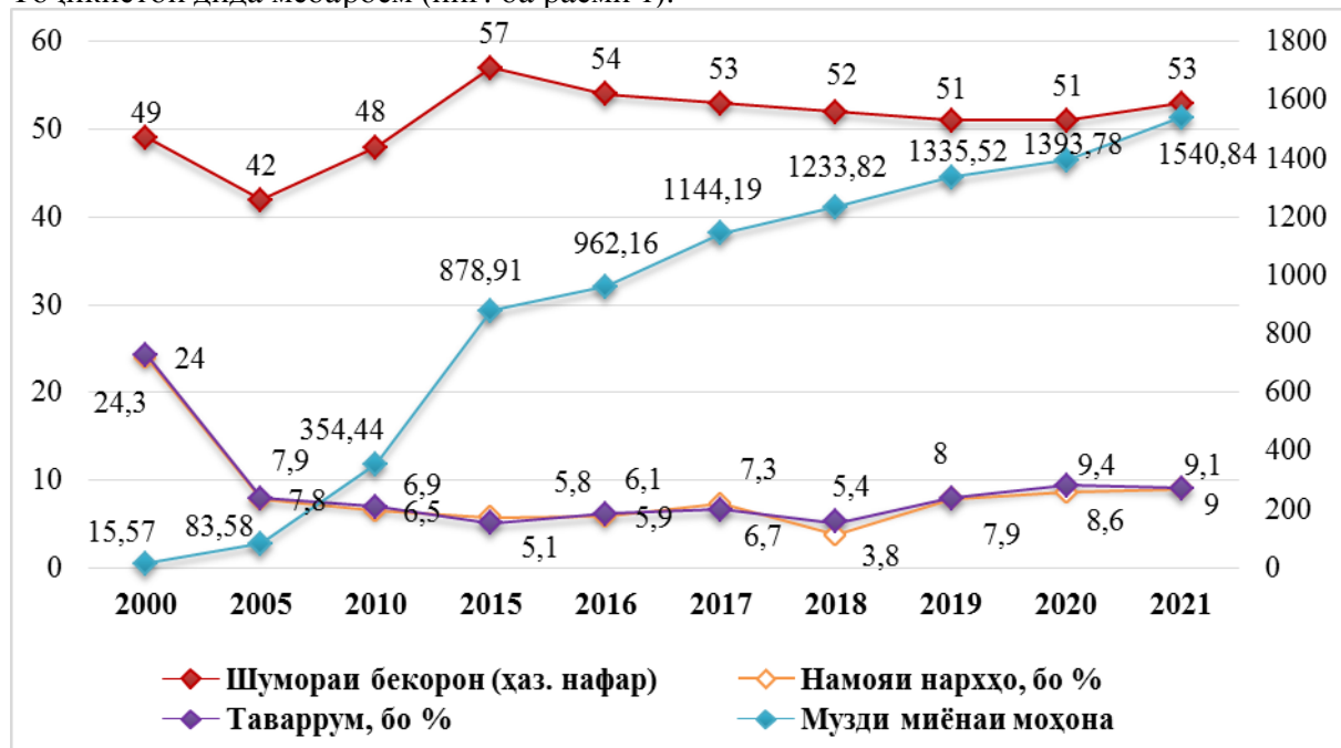
Расми 1. Пӯёии таваррум, музди миёнаи моҳона ва сатҳи нархҳо дар Ҷумҳурии Тоҷикистон* 1. Омори солонии Тоҷикистон, 2022.- С.129-132

Ҳамин тариқ, равандро таваррум ба вазъи иқтисодӣ ва иҷтимоии кишвар таъсири амик мерасонанд. Оқибатҳои манфии таваррум аз кохиши қобилияти харидорӣ, кохиши сармоягузориҳо ва рушди иқтисодӣ ва ҳалалдор шудани низоми молиявӣ иборат аст. Аммо дараҷаи муайяни таваррумро ҳамчун воситаи ҳавасмандгардонии иқтисодӣ истифода бурдан мумкин аст. Таҳия ва татбиқи сиёсат ва тадбирҳои муҳим аст, ки сатҳи таваррумро зерин назорат гирифта, таъсири манфии онро ба иқтисодӣ ва ҷомеа ба ҳадди ақал расонанд. Оид ба таъсири таваррум ба сатҳи иқтисодӣ дар назарияи иқтисодӣ ақидаҳои гуногун вучуд доранд. Аз ҷумла иқтисоддон Е.Э.Филлипс [18, с.254-281] дар натиҷаи омӯختани нишондиҳандаҳои садсолаи Англия ба ҳулосае меояд, ки байни таваррум, музди қор ва дараҷаи нархҳо вобастагӣ вучуд дорад. Ба ақидаи ӯ давлат якуҷабора таваррум ва сатҳи бекориро паст карда наметавонад. Дар ҳолати паст кардани сатҳи таваррум сатҳи бекорӣ зиёд мешавад ва баръакс, дар ҳолати паст кардани сатҳи бекорӣ сатҳи бекурбшавии пул меафзояд. Агар давлат кушиши зиёд кардани музди қорро пеш гирад, қобилияти харидорӣ аҳоли зиёд шуда сатҳи нархҳо баланд мегарданд ва сатҳи таваррум меафзояд. Ҳоло бошад, мо нуқтаи назари Филлипсро дар мисоли Ҷумҳурии Тоҷикистон дида мебароем (ниг. ба расми 1).