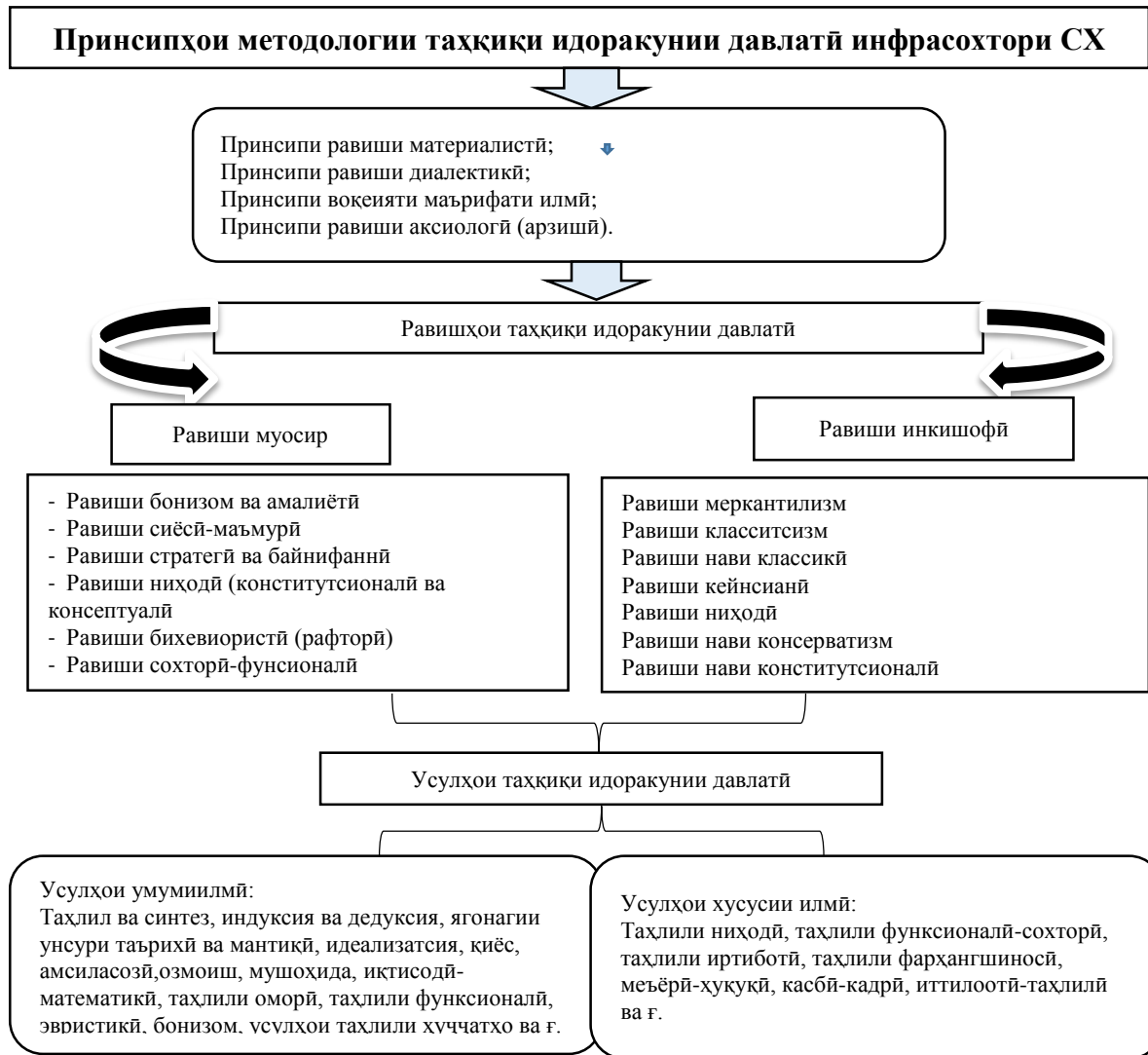
Расми 2. - Маҷмӯи методологии таҳқиқи идоракунии давлатӣ СХ

Равиши сиёсӣ-маъмурӣ нисбати идоракунии давлатӣ мувофиқати манфиатҳо, татбиқи тадбирҳои пайваста оиди ноил шудан ба таҳаммулпазирии иҷтимоиро амалӣ менамояд. Равиши мазкур пайвасти сиёсат, ҳокимияти давлатӣ ва идоракунии давлатиро таъмин менамояд.