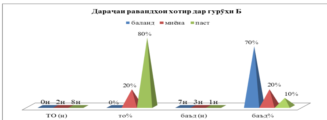
Расми 3. Дараҷаи инкишофи хотира дар хонандагони сустихон