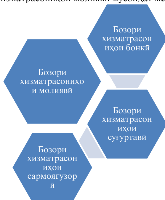
Расми 3. Сохтори бозори хизматрасониҳои молиявӣ

Дар баробари ин, бозори хизматрасониҳои молиявӣ дорои сохтори мушаххаси худ буда, ғаёлияти самараноки ҳар яке аз унсурҳои таркибии он ба самаранокии ғаёлияти бозори хизматрасониҳои молиявӣ мусоидат менамояд (расми 3).