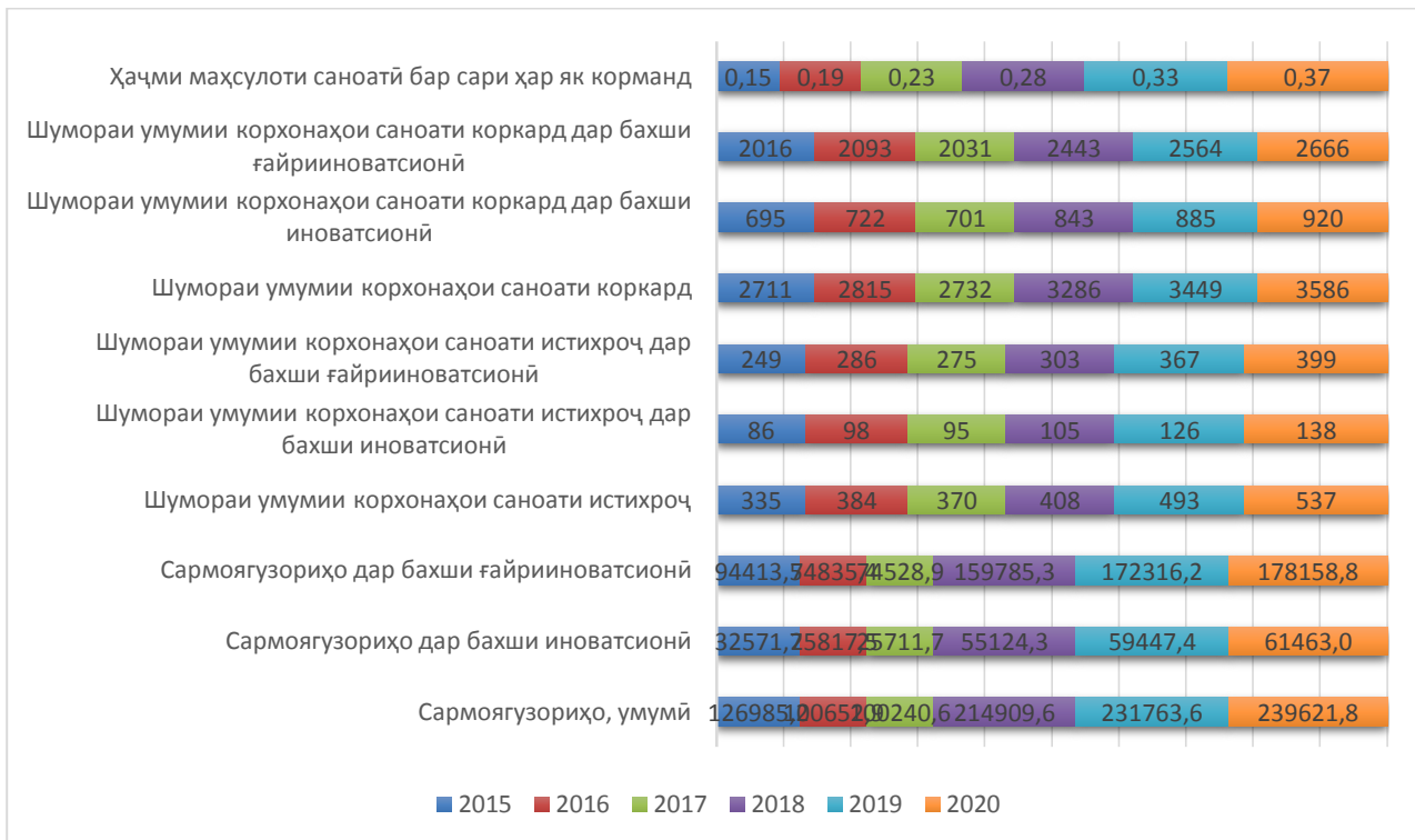
Расми 2. Динамикаи нишондиҳандаҳои рушди бахшҳои саноати Ҷумҳурии Тоҷикистон Сарчашма: Саноати Ҷумҳурии Тоҷикистон: 30 - соли истиқлолияти давлатӣ // Маҷмуаи оморӣ. – Душанбе, Агентии омили назди Президенти Ҷумҳурии Тоҷикистон, 2021. – С.18-29; Тоҷикистон: 30 - соли истиқлолияти давлатӣ // Маҷмуаи оморӣ. – Душанбе, Агентии омили назди Президенти Ҷумҳурии Тоҷикистон, 2021. – С.368-390.

Ҳамин тавр, таҳлил нишон медиҳад, ки бахши инноватсионӣ ва ҳам ғайриинноватсионӣ ҳаҷми истеҳсолоташро афзоиш дода истодаанд. Бояд таъкид кард, ки дар ин раванд бахши инноватсионӣ нисбат ба бахши ғайриинноватсионӣ ба истеҳсолоташ шиддат дода, шумораи шӯбаҳои таҳқиқотиаш низ афзун гардидаанд. [4, С. 368-390].