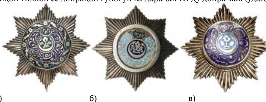
а) б) в) Расми 4. Ордени нукрагии «Нишони доруссалтанаи Бухорои Шариф»-и навъи 3 дараҷаи I (а), II (б) ва III (в).

Дараҷаҳои нукрагии орден низ байни худ фарқи калон доранд. Шакли андозаи ситораҳои дараҷаҳои I, II ва III гуногун буда, бо ғафсии шуоъҳои худ низ фарқ мекунанд. Миқдори доираҳои медалёнҳои дараҷа ва рангҳои онҳо низ фарқ мекунанд: дар дараҷаҳои I ва II монанди орденҳои тиллоӣ се доираҳои гуногун ва дараҷаи III ду доира мавҷуданд.