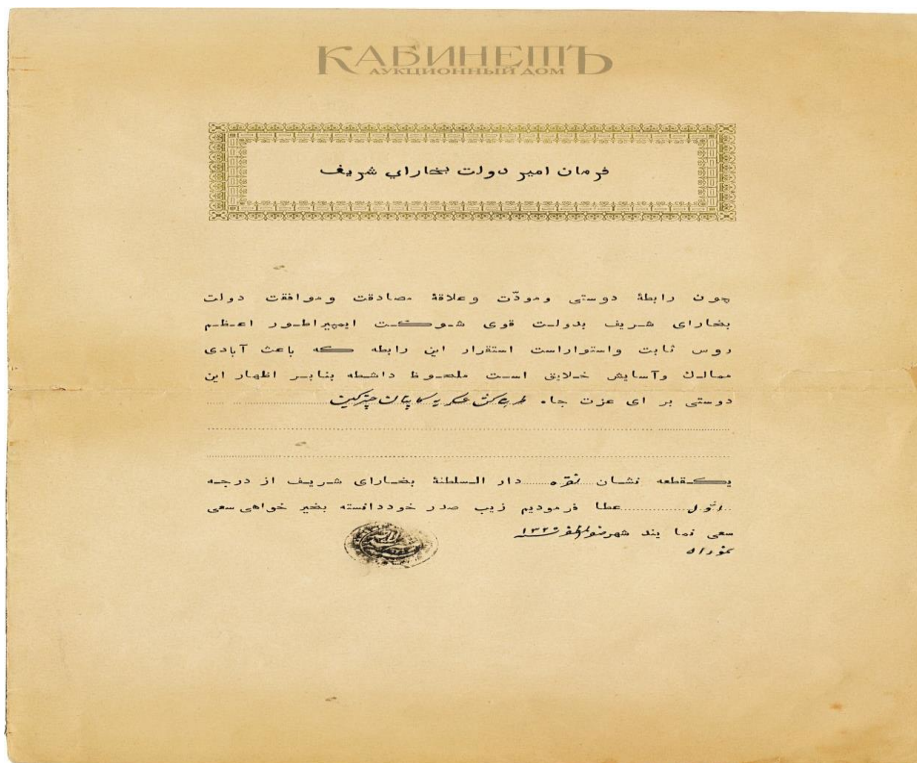
Расми 2. Намунаи Фармони амири давлати Бухорои Шариф дар бораи тақдими дараҷаи аввали “Нишонаи нуқрадорӣ доруссалтанаи Бухорои Шариф” бо забони форсии тоҷикӣ