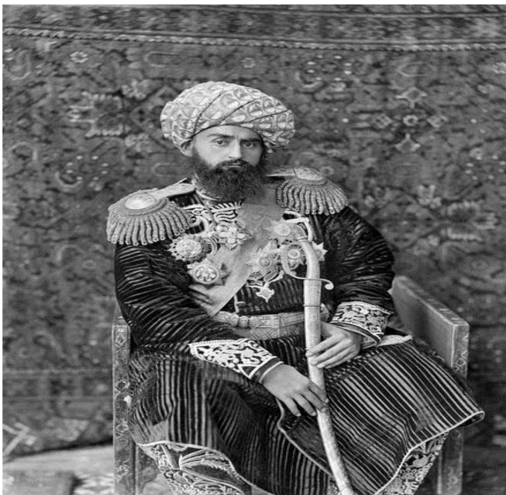
Расми 1. Амир Абдулаҳад бо се ордени Аморати Бухоро (тарафи чапи сина)

Навъи якуми ордени аз тилло сохта шуда, дараҷаи I он бо алмоси суфта (бриллиант) ва дараҷаи II бо алмос оро дода шуда буданд. Мутассифона, ҳоло ин навъи ордени дастрас нест ва дар бораи он маълумоте надорем. Лекин дар баъзе расмҳо тарҳи ин навъи ордени дидан мумкин аст. Масалан, дар расми амир Абдулаҳад, ки онро соли 1890 суратгир Пол Надар гирифтааст [10], дар синаи чапи амир се ордени Аморати Бухоро насб аст (ниг. ба расми 1). Яке аз онҳо ордени «Нишони тоҷи доруссалтанаи Бухорои Шариф» ва дуи дигар «Нишони доруссалтанаи Бухорои Шариф», ки ба сарсӯзани ороишӣ (брошқа) ё масуноти заргарӣ монандӣ доранд. Аз таҳқиқоти мо маълум шуд, ки ин ҳамон навъи якуми ордени мазкур, дараҷаҳои I ва II аст. Амир Абдулаҳад дар «Рӯзнома»-и сафари худ ба Россия (1893) дар бораи мукофотонидани мансабдорони олирутбаи Россия бо ин ордени маълумоти муфассал додааст [14]. Ба ҳар мукофотонидашуда дар як вақт ордени ва фармон (ба забони тоҷикӣ ва русӣ) бо имзо ва муҳри амир супорида мешуд (ниг. Расми 2.3).