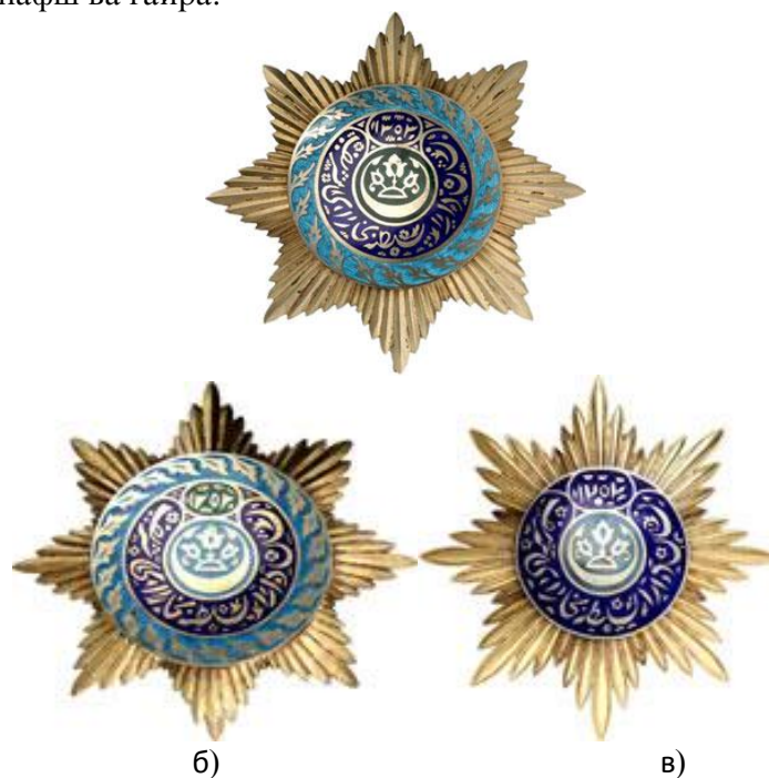
а) б) в) Расми 6. Ордени тиллоии «Нишони доруссалтанаи Бухорои Шариф»-и навъи 2 дараҷаҳои I (а), II (б) ва III (в).

дошт. Дар маркази ситораи ҳаштгӯшаи шуоъхояш ғавс, медалйони ҳамвор ба се доираҳои кутрашон гуногун тақсим карда шудааст. Дар рӯи доираи калонтарини беруна сири кабуд давонида шуда, тасвири баргхоро дорад. Пас аз он дар доираи миёнаи бунафш навиштаҷоти «Нишони доруссалтанаи Бухорои Шариф» (دار السلطنة بخارای شریف نشان) ва дар доираҳои сабзи он соли 1303 (1303) / (1885) тасвир шудааст. Дар маркази медалйон доираи кабудӣ хурдтар чойгир аст, ки он бо расми моҳи нав (ҳиллол) ва гул ороиш ёфтааст. Агар ба расми орденҳои тиллоӣ хуб назар афканем, фарқи байни дараҷаи I ва дараҷаи III баръало намоён мешавад. Ғафсии шуоъҳои дараҷаҳои орден гуногун; доираи марказии медалйони дараҷаи I ва III - кабуд, дараҷаи II – сабз; ранги доираҳои санаи ба салтанат нишастани амир дар дараҷаи I – сабз, дар дараҷаи II ва III – бунафш ва ғайра.