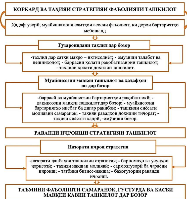
Расми 1. Стратегияи фаъолияти ташкилот дар бозор

Бонкҳои тиҷоратӣ низ ҳамчун ташкилотҳои махсусе, ки дар бозори молия амал менамоянд, ба стратегияи такмилёфтаи рушд ниёз доранд. Стратегияи рушди бонк дорои хусусиятҳои хоси худ буда, тамоми паҳлӯҳои фаъолияти бонкҳо бояд фарогир бошад. Зеро идоракунии бонк раванди мушкил буда, аз менечерони бонк донишӣ кофӣ ва малакаи касбиро тақозо мекунанд. Таҳқиқотҳо нишон медиҳанд, ки таквиятёбии кори бонкҳо аз дараҷаи саводнокии роҳбарияти он вобаста буда, менечмент дар доираи стратегияи рушд мавқеи калидири доро мебошад.