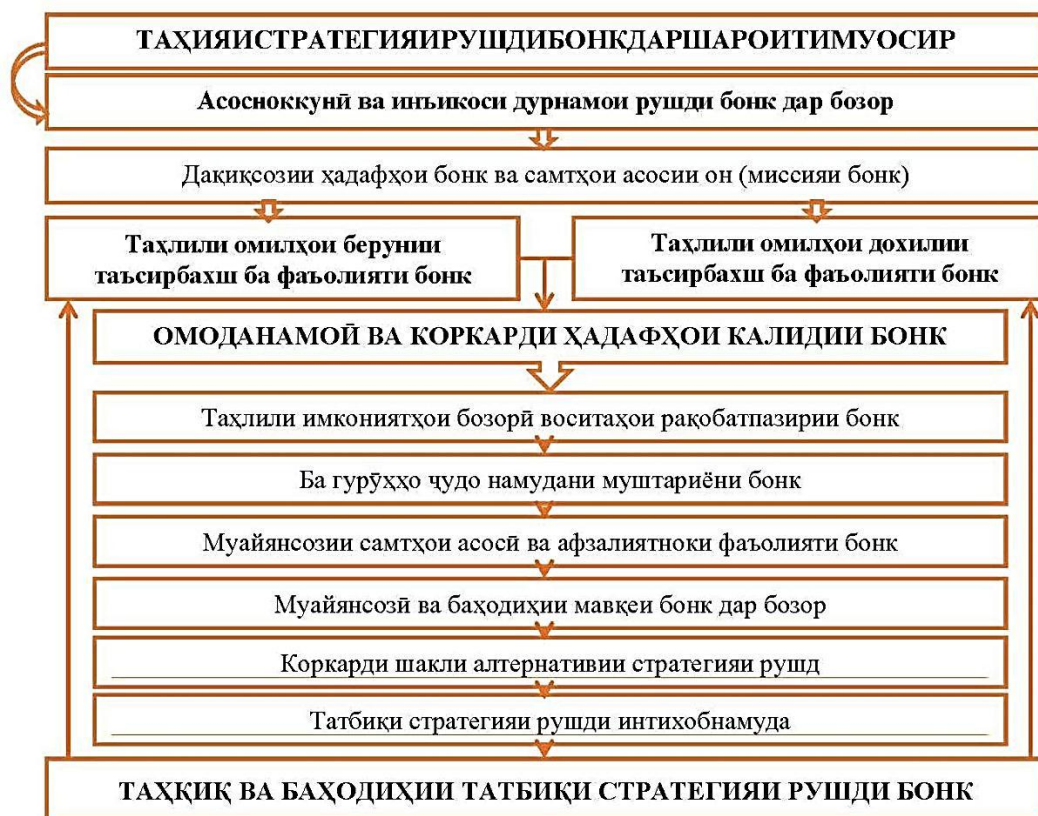
Расми 3. Таҳия ва ташкилии стратегияи рушди банк