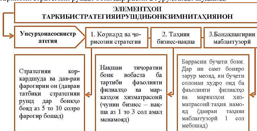
Расми 2. Унсурҳои таркибии стратегияи рушди бонк