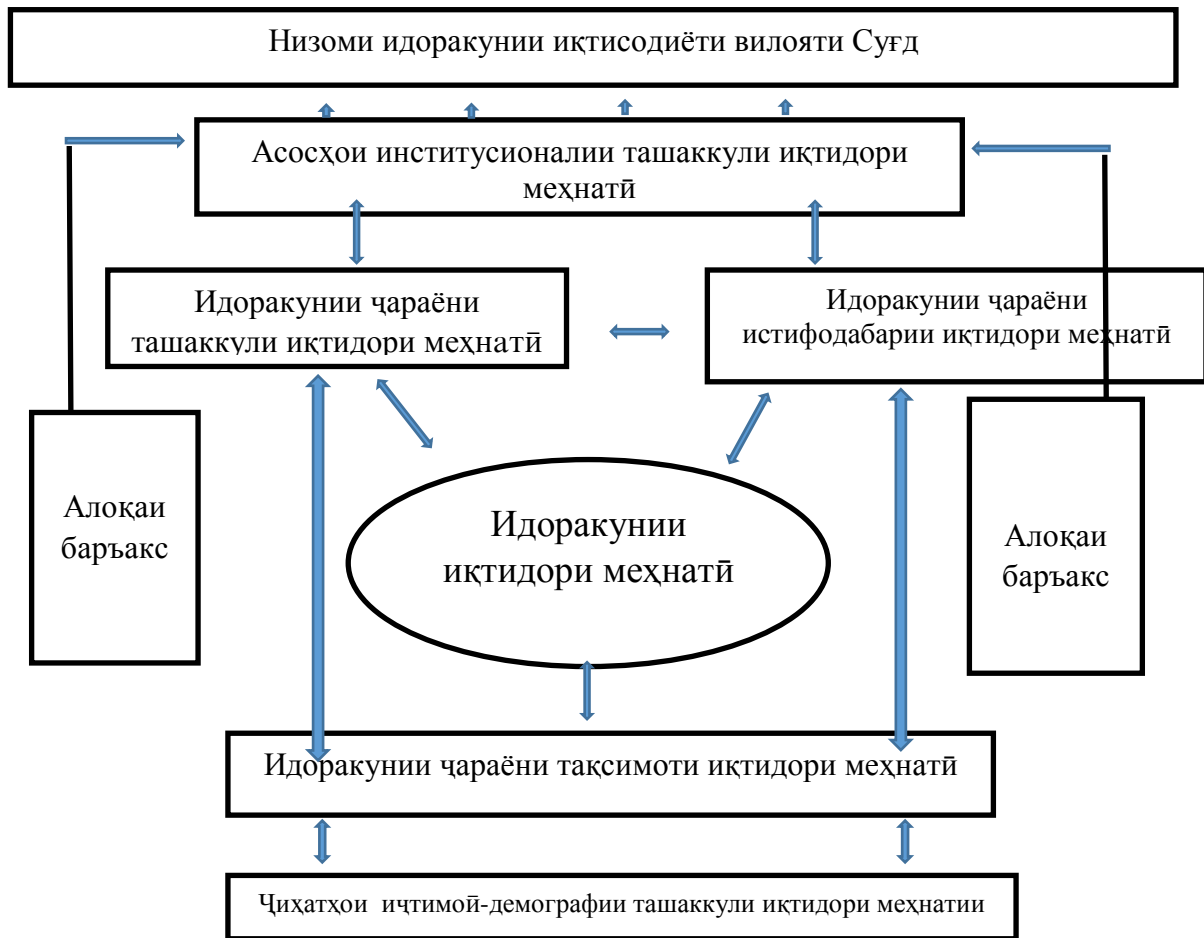
Расми 1. Низоми идоракунии иқтисодии меҳнатии минтақа дар низоми умумии идоракунии иқтисодиёти минтақа

Бинобар ин, низоми идоракунии иқтисодии минтақа зернизомии мураккаби динамикии низоми умумии идоракунии иқтисодиёти минтақа ва умуман кишвар мебошад, ки дар зер нишон дода шудааст.