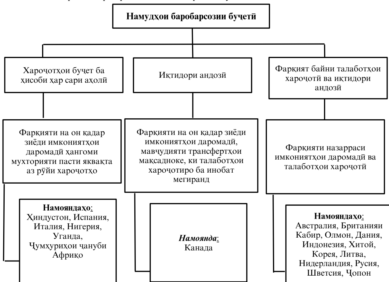
Расми 2 – Тамсилаҳои асосии баробарсозии бучетӣ*

Амалан, ин истифодаи афзалиятноки бучети давлатро ҷиҳати ҳадафҳои ҷамъиятиву иқтисодӣ ифода намуда, «бақия» - и он барои истеъмолати шахсӣ тақсим мешуд. Таъсири ин принцип ҳамчунин дар иқтисодиёти табaddулотӣ боқӣ мемонад ва имконоти ҳалли масъалаҳоеро, ки танзими даромади аҳолиро таъмин месозанд, маҳдуд менамояд. Дар иқтисодиёти нақшавӣ усули асосии танзими даромади аҳоли маъмурӣ-ҳуқуқӣ ба ҳисоб мерафт, ки ба қувваи ҳокимият асос меёфт. Дар ин ҳол, ҳамаи масъалаҳои тақсим ва бозтақсими даромад дар маркази ягона ҳал карда мешуд.