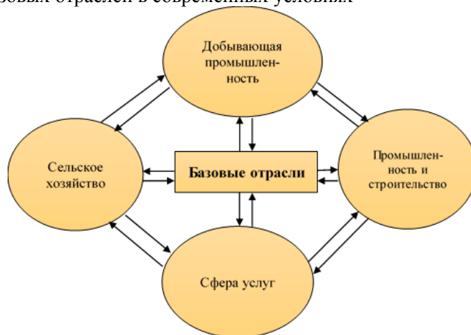
Взаимосвязь базовых отраслей в современных условиях