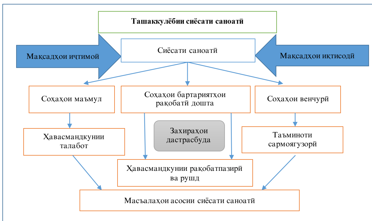
Расми 2. Ташаккулёбии соҳаи сийсати саноатӣ