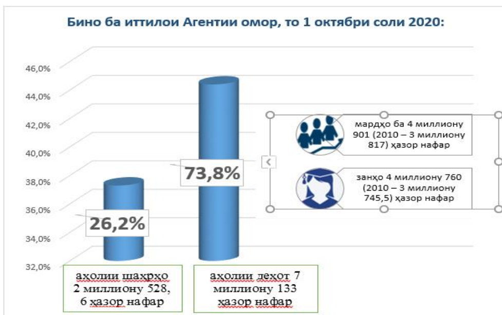
Расми 2. Теъдоди аҳолинишини шаҳру деҳоти Ҷумҳурии Тоҷикистон то 1 октябри соли 2020.

Фармони Асосгузори сулҳу ваҳдати миллӣ - Пешвои миллат, Президенти Ҷумҳурии Тоҷикистон муҳтарам Эмомалӣ Раҳмон “Дар бораи гузаронидани барӯйхатгирии аҳолии Тоҷикистон” 30 сентябри соли 2020 ба имзо расида буд. Ин барӯйхатгирӣ бо ҳимояти Сандуқи чамъияти СММ (UNFPA), тибқи Барномаи тақвияти омили чамъиятӣ дар Тоҷикистон барои давраи 2020 - 2023 анҷом дода шуда, тавассути ҳукумати Федератсияи Россия ба маблағи 2.15 миллион доллар сармоягузори мегардад. Мақомоти Ҷумҳурии Тоҷикистон ба далели танзими таваллуд ва оила барномаи махсуси давлатӣ барои солҳои 2019 - 2022 қабул кардаанд, ки дар доираи он дар кишвар барои тарбияи тарғиби тарзи ҳаёти солим ба назар гирифта шудааст.