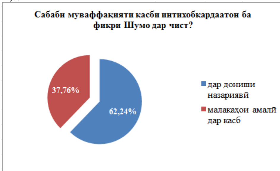
Расми 4.Натиҷаи пурсишнома доир ба муайянкунии тавачҷӯҳи хонандагон ба назария ва амалияи касб

Саволи чоруми пурсишнома муайян кард, ки довталабон бештар ба кадом омил тавачҷӯҳдоранд: ба донишҳои назариявӣ ё малакаҳои амалӣ дар касб? Натиҷаҳои ҷавобҳо дар расми 4 нишон дода шудааст.