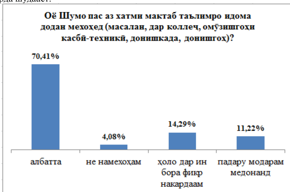
Расми 1. Натиҷаи назарсанҷии хонандагон доир ба идомаи таҳсил баъд аз хатм

Саволи аввал воқеан як саволи муқаддимаӣ буд, ки мусоҳибро барои пурсиш омода кард ва нияти хонандагонро барои идомаи таҳсил пас аз хатми мактаб нишон дод, ки натиҷаҳои он дар расми 1 оварда шудааст.