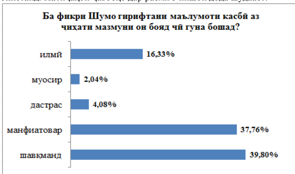
Расми 5.Натиҷаи пурсиши хонандагон доир ба мазмуни таҳсилоти касбӣ

Саволи панҷум ва охири пурсишнома чунин буд: «Ба фикри Шумо гирифтани таҳсилоти касбӣ аз ҷиҳати мазмуни он бояд чӣ гуна бошад?» Пурсидашудагон танҳо як ҷавобро интихоб карда метавонистанд. Натиҷаҳои ҷавобҳо дар расми 5 нишон дода шудааст.