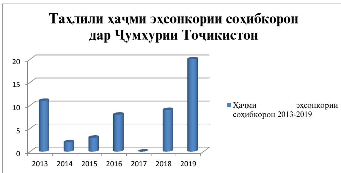
Диаграмма аз ҷониби муаллиф тартиб дода шудааст.

Зимни маълумотҳои оморӣ ва ҷамъоваришуда маблағҳои эҳсонкорӣ ба соҳаҳои иҷтимоӣ дар давоми соли 2013- 2019 зеро таҳлил ва омӯзиш қарор дода шуд, ки дар ҷадвали № 1 ва диаграммаҳои № 1 ва 2, 3 оварда шудааст.